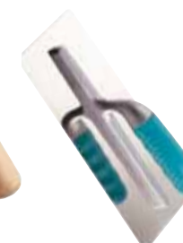
Llana Estucador Mango Síntesi