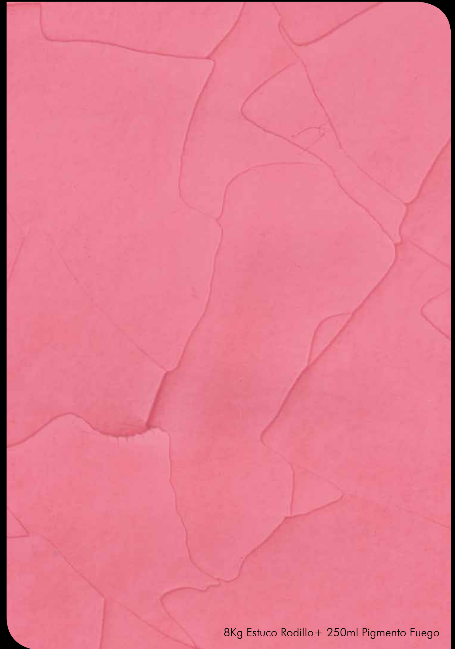
8Kg Estuco Rodillo+ 250ml Pigmento Fuego