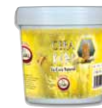
Cera Kepi 0,5L/1L/2L 30-40 m2/L