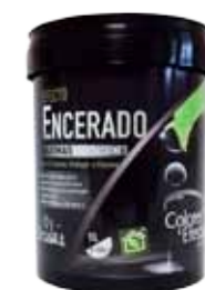
Efecto Encerado 1L 30 m2/L