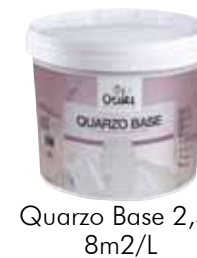
Quarzo Base 2,5L 8m2/L