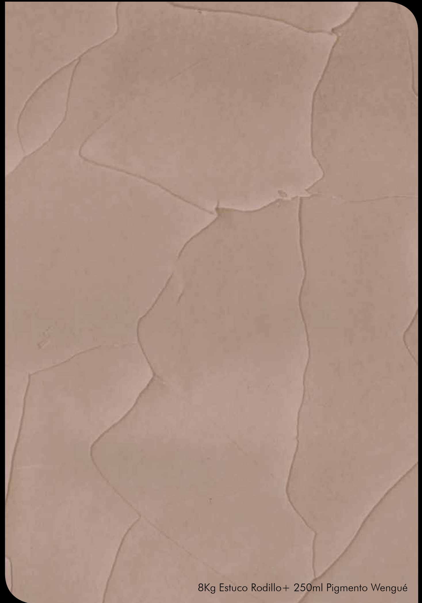
8Kg Estuco Rodillo+ 250ml Pigmento Wengué