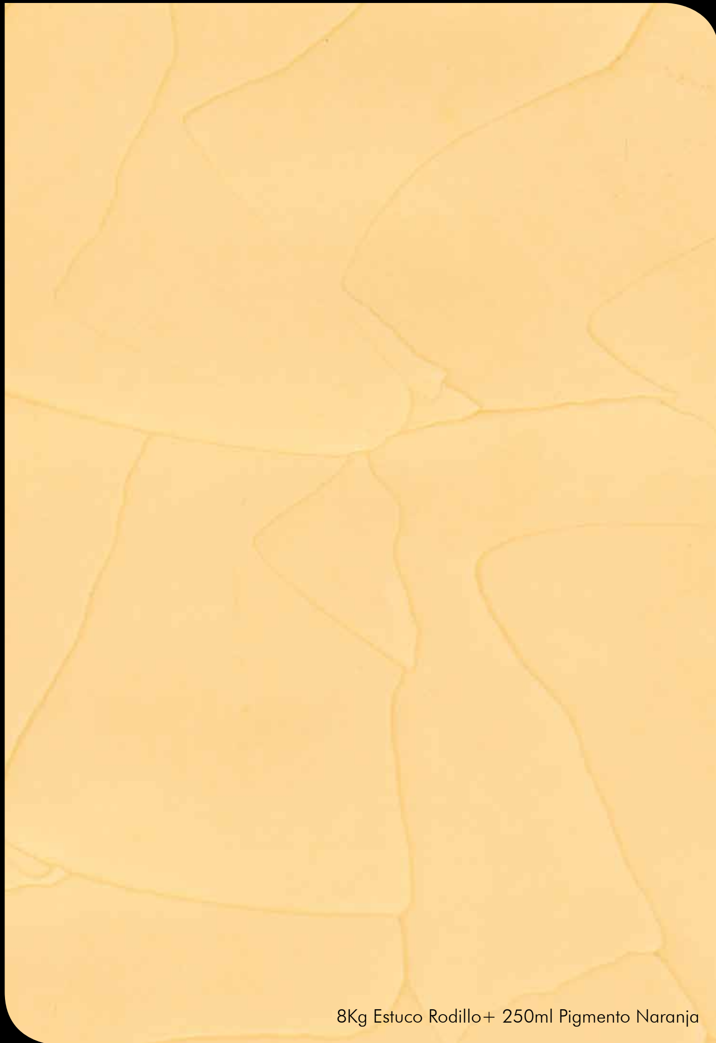
8Kg Estuco Rodillo+ 250ml Pigmento Naranja