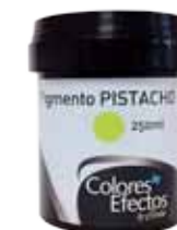
Pigmento 250 ml