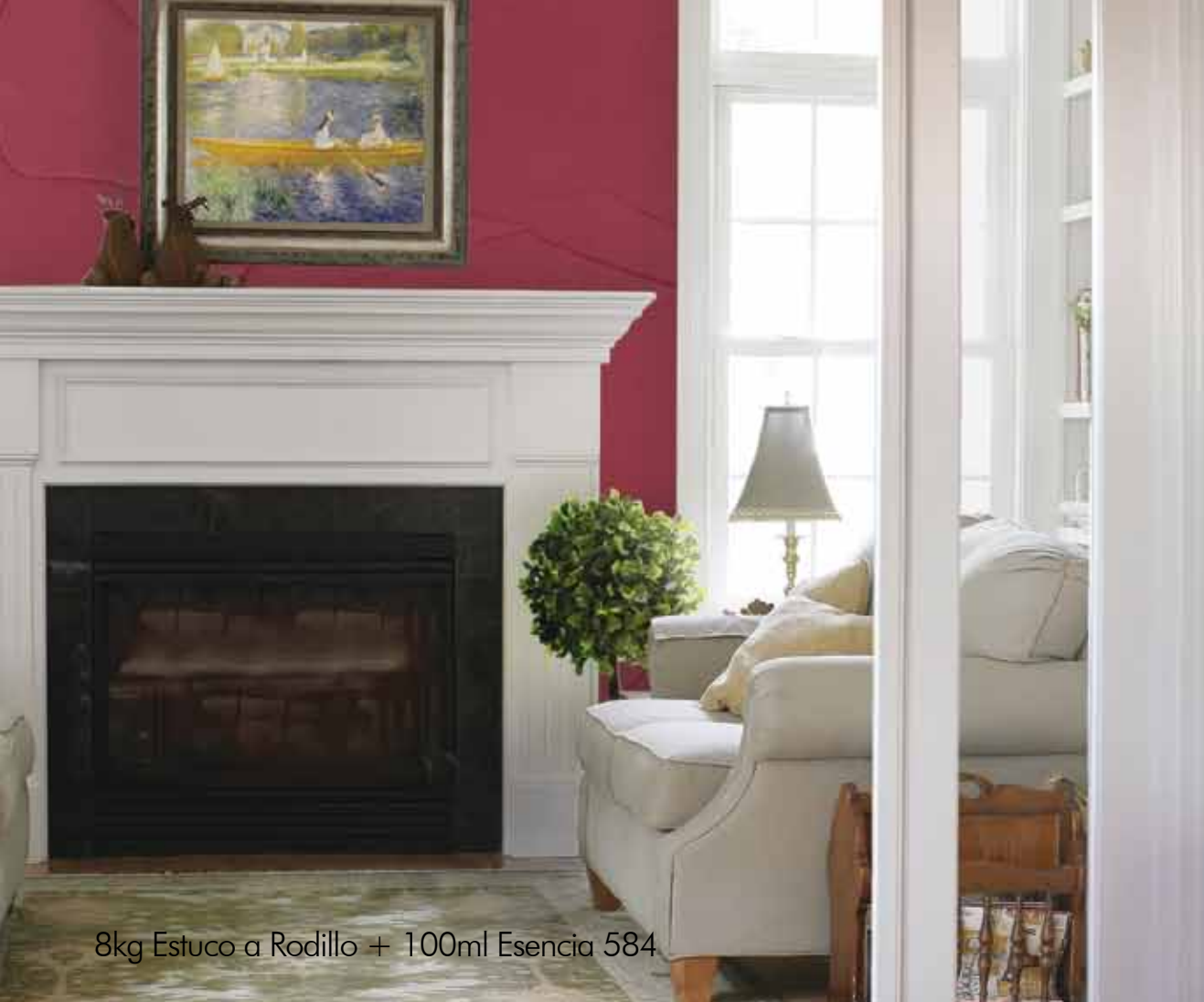
8kg Estuco a Rodillo + 100ml Esencia 584