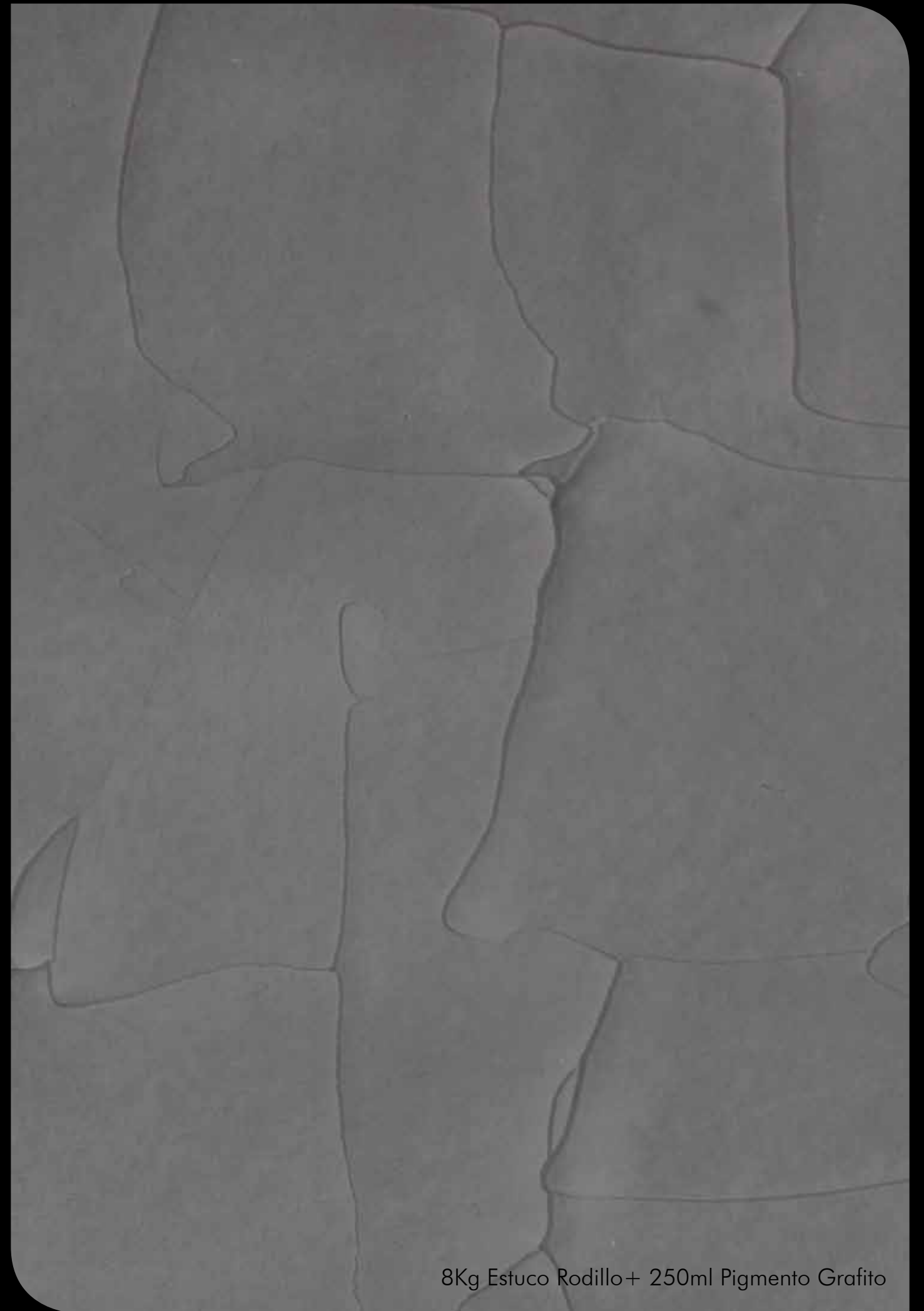
8Kg Estuco Rodillo+ 250ml Pigmento Grafito