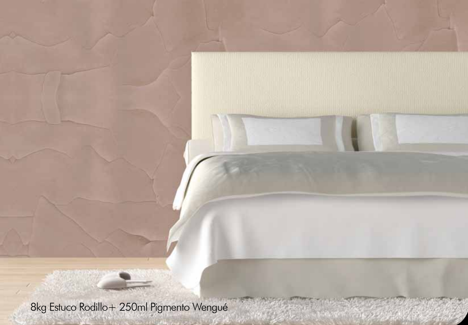
8kg Estuco Rodillo+ 250ml Pigmento Wengué