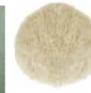
Almoadilla de lana natural