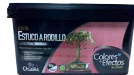
Estuco a Rodillo 8 kg 10-12m2