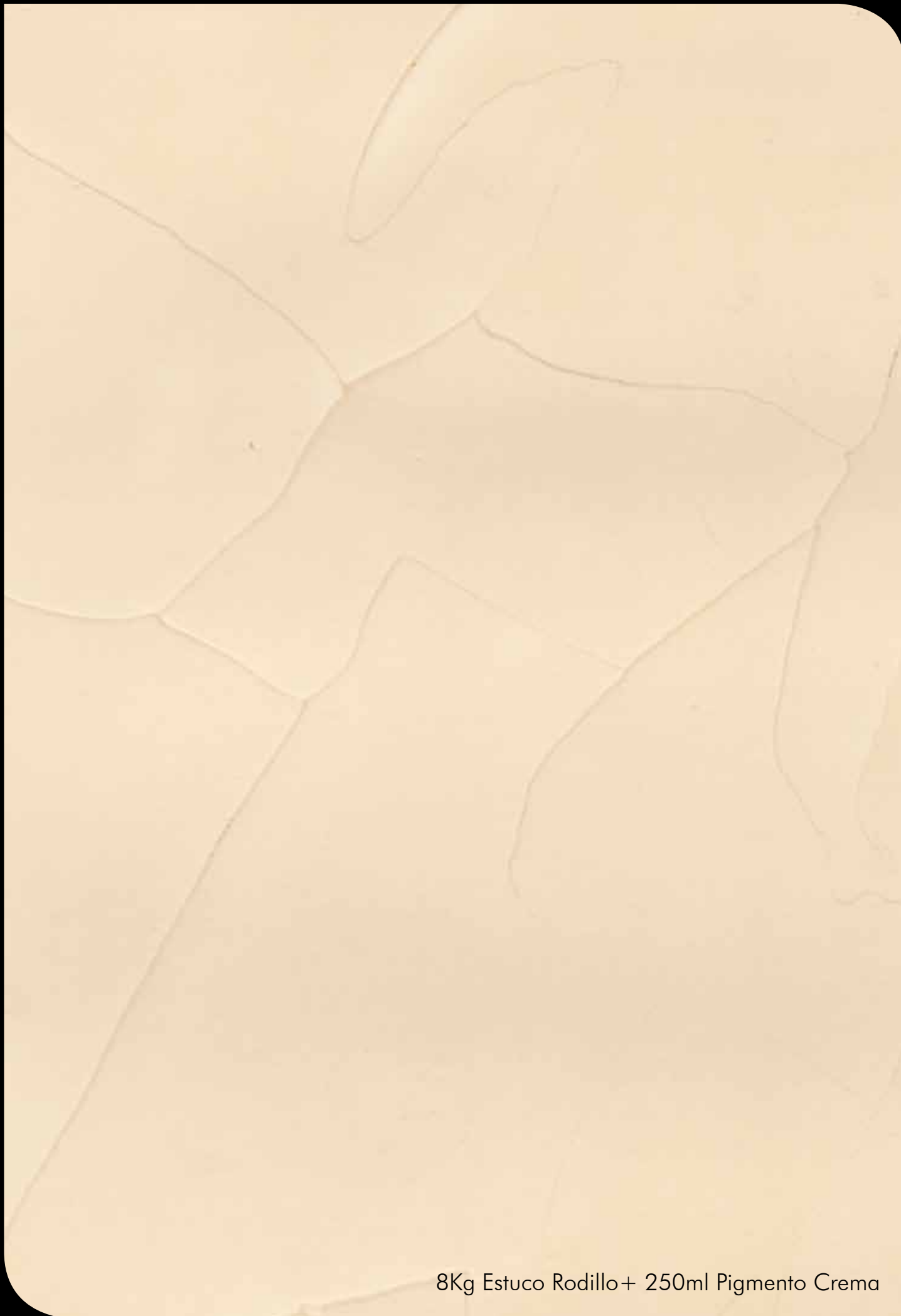
8Kg Estuco Rodillo+ 250ml Pigmento Crema