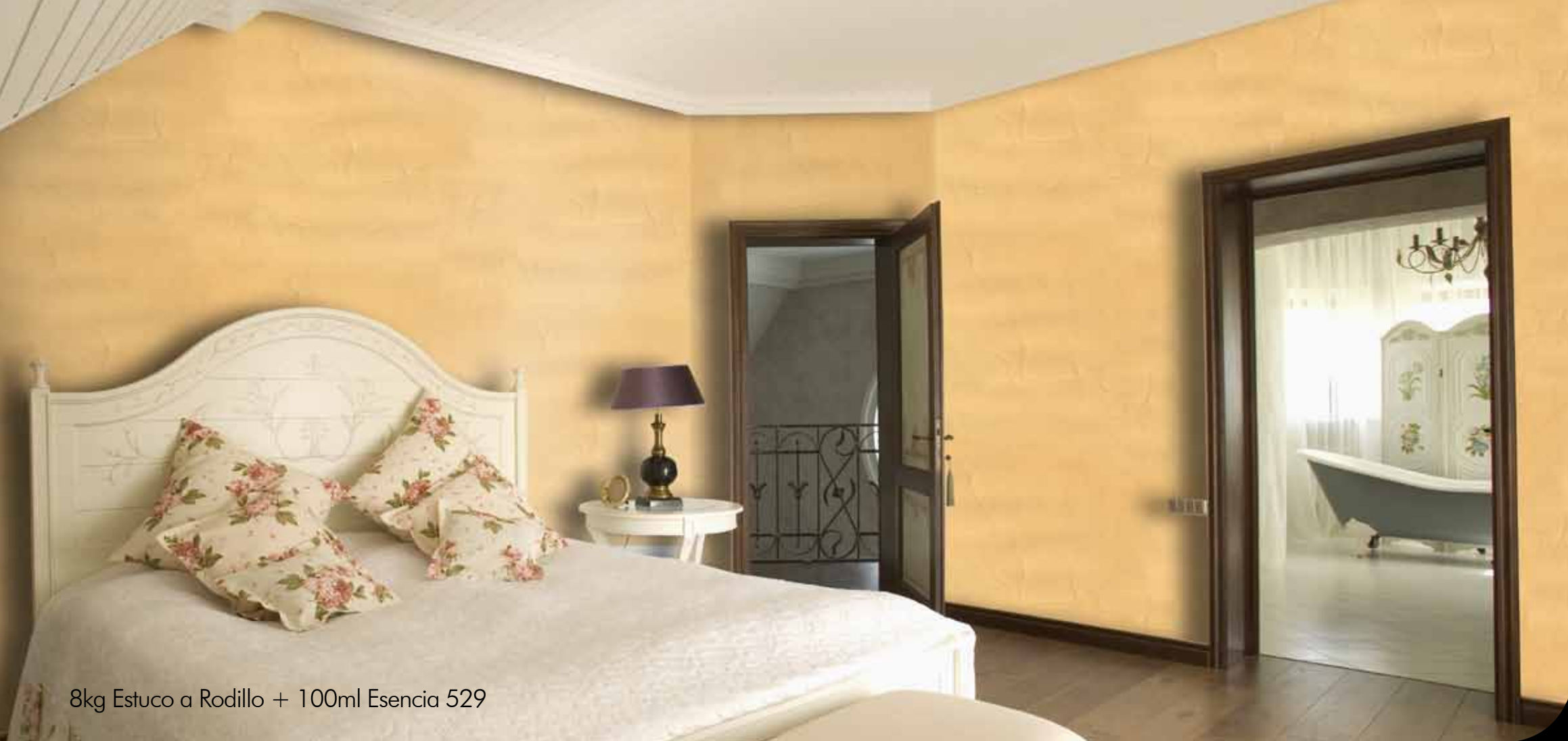
8kg Estuco a Rodillo + 100ml Esencia 529