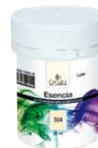
Esencia 480 ml