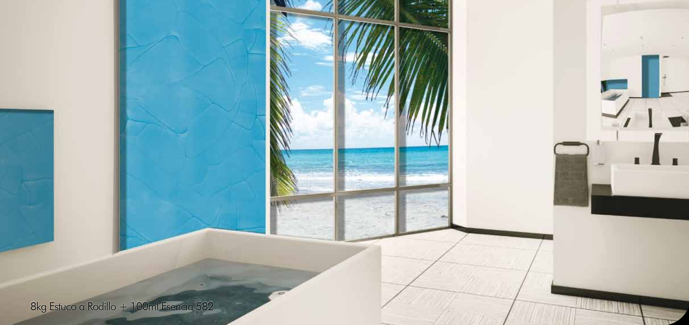
8kg Estuco a Rodillo + 100ml Esencia 582