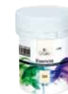
Esencia 100 ml