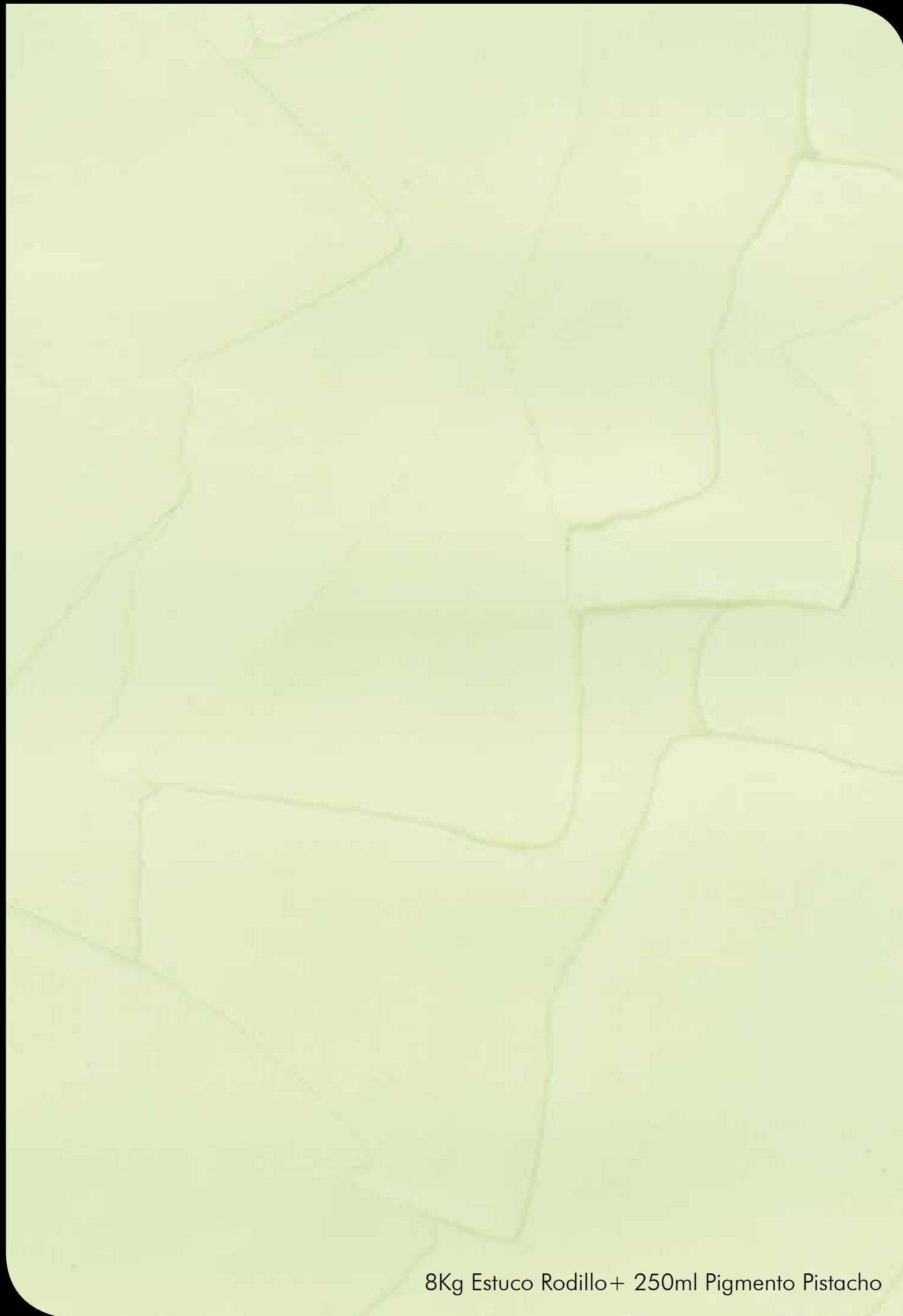
8Kg Estuco Rodillo+ 250ml Pigmento Pistacho