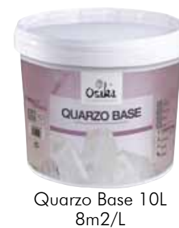
Quarzo Base 10L 8m2/L

FR Une fois sèche, la surface peut être protégée appliquant une couche très fine de Sir Kepi, Efecto Encerado ou Cera Sintética.