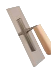
Llana Estucador Mango Madera